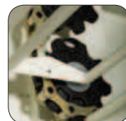
Tandwiel met bronzen ring