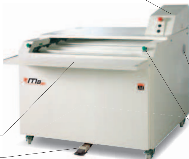
Uitklapbare opbolplaat in optie