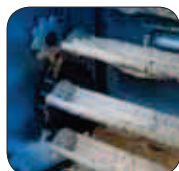
Optionele uv-behandeling met beschermluik

Verder is de machine ook voorzien van elektrische stopcontacten voor de vormgeefmachine en de verdeler, en beschikt ze over een handmatige bedieningsknop rechts/links en een zeer ergonomische "handenvrij"-bediening. Optionele kiemdodende behandeling voor extra hygiëne.